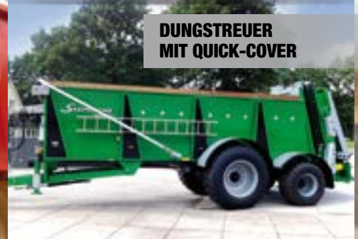
DUNGSTREUER MIT QUICK-COVER