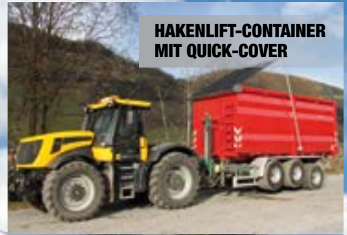
HAKENLIFT-CONTAINER MIT QUICK-COVER